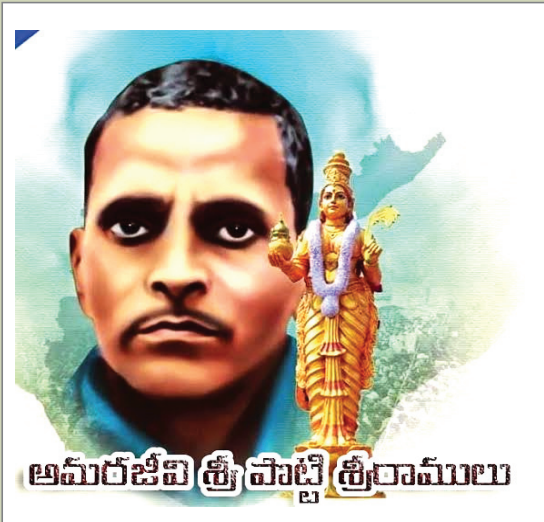
అమరజీవి శ్రీ పొట్టి శ్రీరాములు

భాషా ప్రయుక్త రాష్ట్రాలు ఏర్పడటానికి ప్రధానమైన వ్యక్తి అమరజీవి పొట్టి శ్రీరాములుగారు. వారి అమరణ నిరాహార దీక్షతో, ప్రాణత్యాగంతో ఆంధ్రప్రదేశ్ అవతరించింది. వారికి ఘన నివాళిని అర్పిస్తూ వారిని స్మరిస్తోంది..